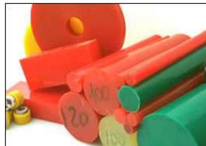
TARUGOS DE POLIURETANO