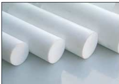
TARUGOS DE TEFLON

Placas, Tarugos, Tubos e peças em: Acrílico, Celeron, Nylon, Policarbonato, Polietileno, PVC, Polipropileno, Poliuretano, Teflon e UHMW.