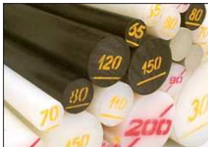
TARUGOS DE NYLON