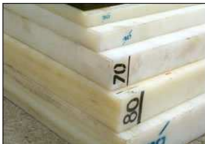
PLACAS DE NYLON