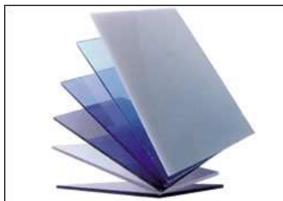
PLACAS DE ACRÍLICO